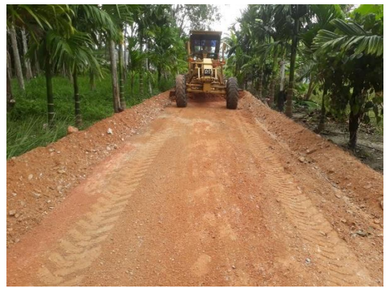
ภาพระหว่างดำเนินงาน