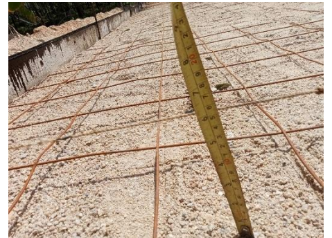
ภาพระหว่างดำเนินการ