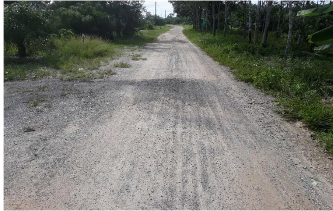
ภาพก่อนดำเนินการ