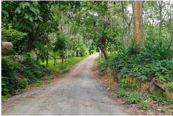
ภาพก่อนดำเนินการ

หมู่ที่ ๑๒ ต.ควนทอง อ.ชนอม จ.นครศรีธรรมราช