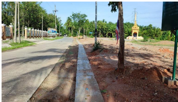
ภาพดำเนินการแล้วเสร็จ