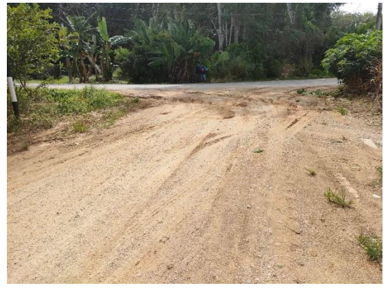
ภาพก่อนดำเนินการ