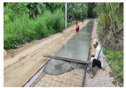
ภาพระหว่างดำเนินการ