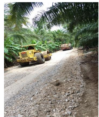
ภาพระหว่างดำเนินการ