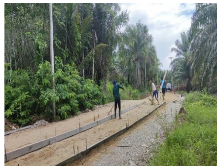
ภาพระหว่างดำเนินการ