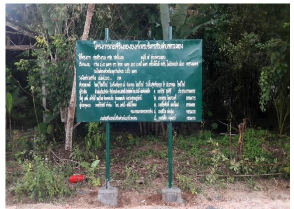
ภาพดำเนินการแล้วเสร็จ