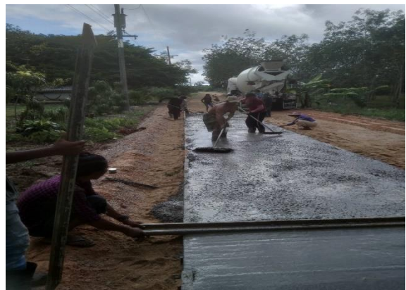
ภาพขณะดำเนินการ