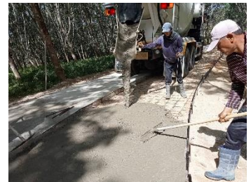
ภาพระหว่างดำเนินการ