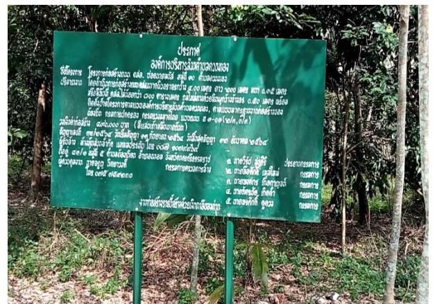
ภาพดำเนินการแล้วเสร็จ