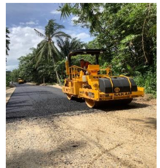
ภาพระหว่างดำเนินการ