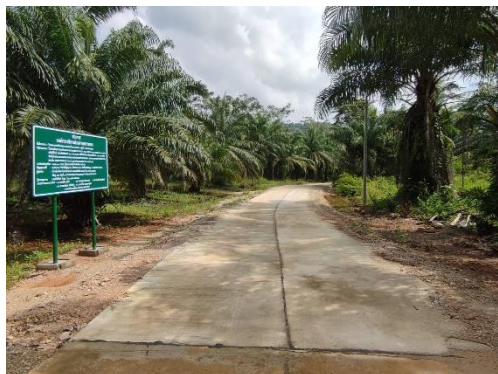
ภาพดำเนินการแล้วเสร็จ