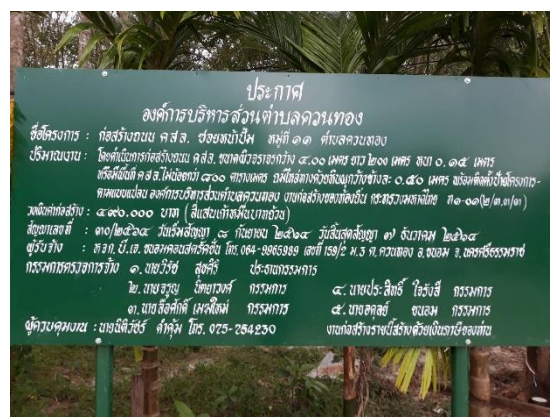
ภาพดำเนินการแล้วเสร็จ