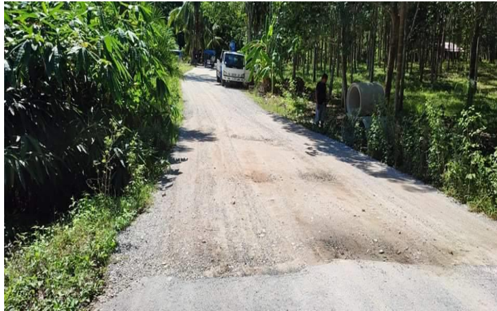
ภาพก่อนดำเนินการ