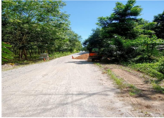
ภาพก่อนดำเนินการ