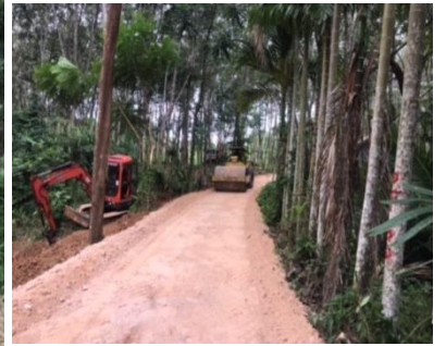
ภาพระหว่างดำเนินการ