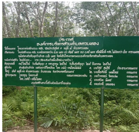
ภาพดำเนินการแล้วเสร็จ