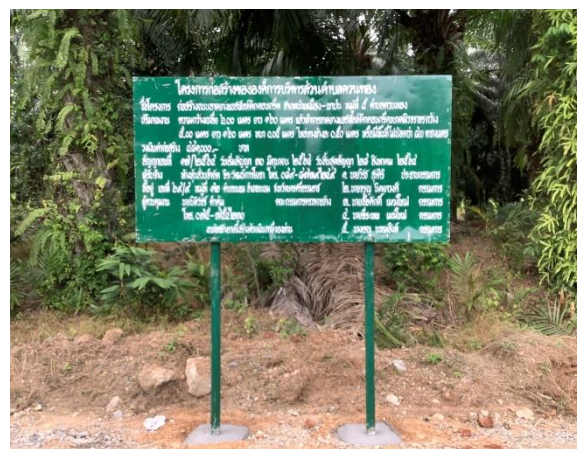
ภาพดำเนินการแล้วเสร็จ