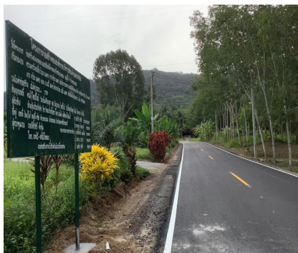
ภาพดำเนินการแล้วเสร็จ