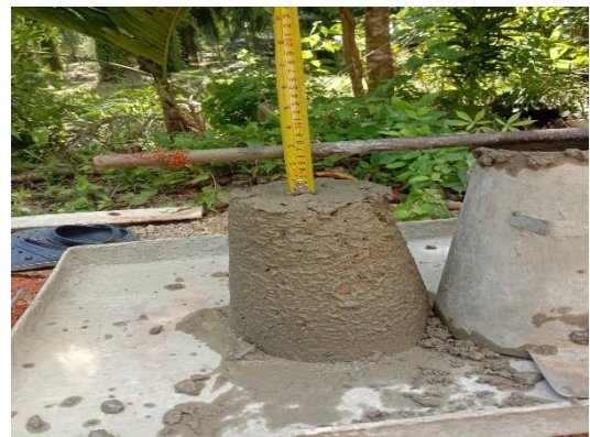
ภาพระหว่างดำเนินงาน