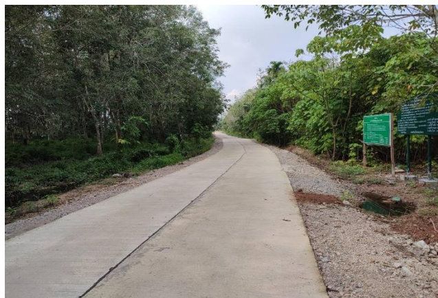
ภาพดำเนินการแล้วเสร็จ