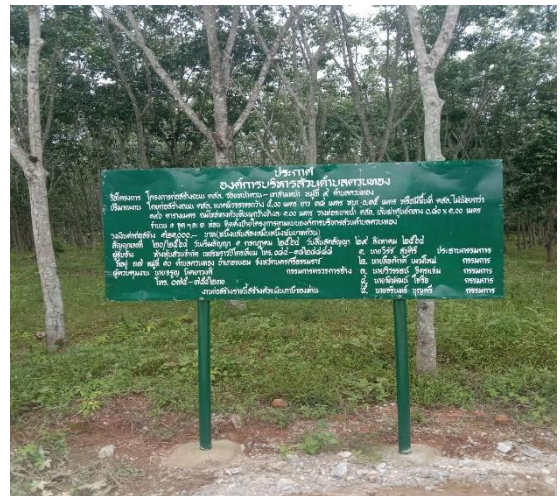
ภาพดำเนินการแล้วเสร็จ