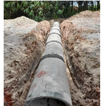
ภาพระหว่างดำเนินการ