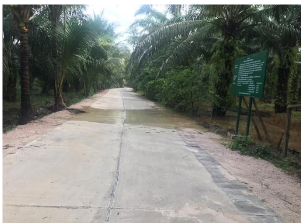
ภาพดำเนินการแล้วเสร็จ