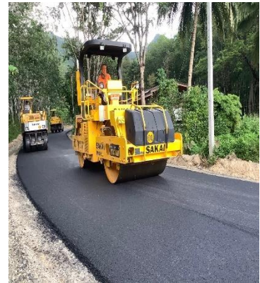
ภาพระหว่างดำเนินการ