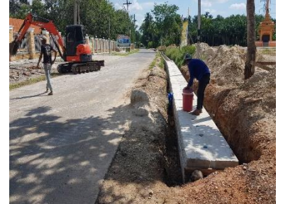
ภาพระหว่างดำเนินการ