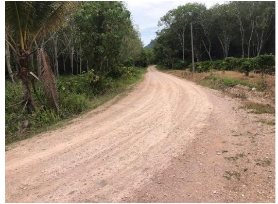
ภาพก่อนดำเนินการ