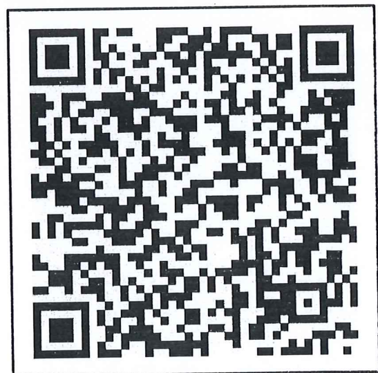
สแกน QR-Code เพื่อสมัครเข้าประกวด